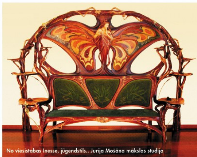
No viesistabas Inesse, jūgendstils. Jurijs Mošāns mākslas studija