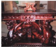
Galds. Agra Godiņa diplomdarbs