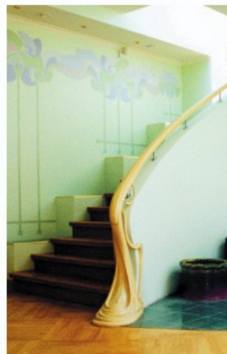
Kāpnes no bērza, jūgendstils. Jurijs Mošāns mākslas studija

Ir dažādi veidi, kā klienti un meistari atrod viens otru. Latvijā nozīmīga ir meistara labā slava. Nereti labs darbs runā pats par sevi – koka mēbeles, kas izvietotas sabiedriskā vai citā pieejamā