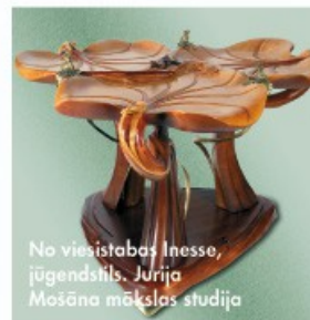
No viesistabas Inesse, jūgendstils. Jurijs Mošāns mākslas studija